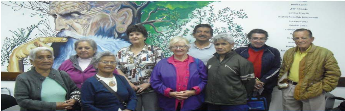
Contribuyendo a la Educación Financiera en el país.