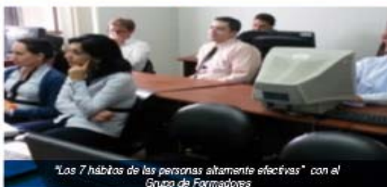
"Los 7 hábitos de las personas altamente efectivas" con el Grupo de Formadores