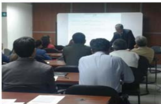
Charla "Los 7 hábitos de las personas altamente efectivas" en la ciudad de Quito