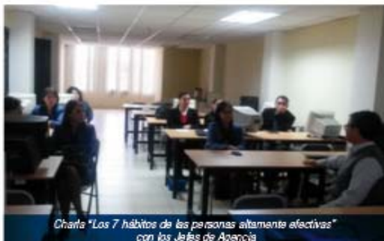
Charla "Los 7 hábitos de las personas altamente efectivas" con los Jefes de Agencia