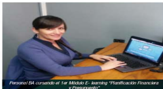
Personal BA cursando el 1er Módulo E-learning "Planificación Financiera y Presupuesto"