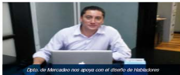
Dpto. de Mercadeo nos apoya con el diseño de Habladores