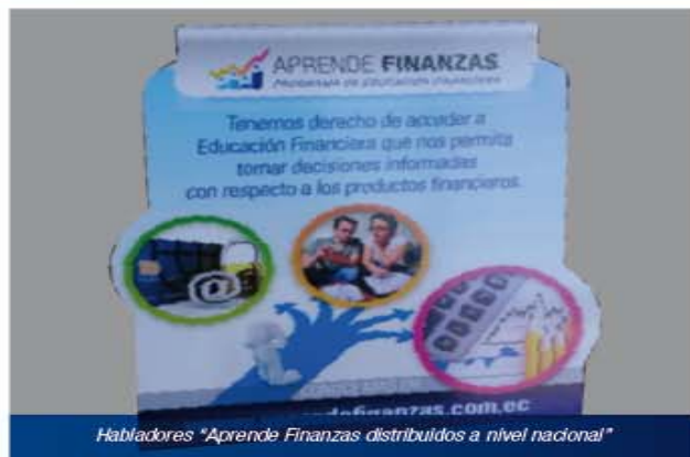
Habladores "Aprende Finanzas" distribuidos a nivel nacional