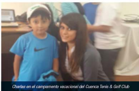
Charlas en el campamento vacacional del Cuenca Tennis & Golf Club