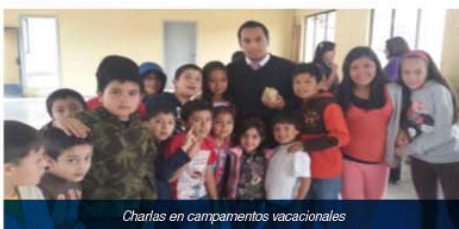
Charlas en campamentos vacacionales