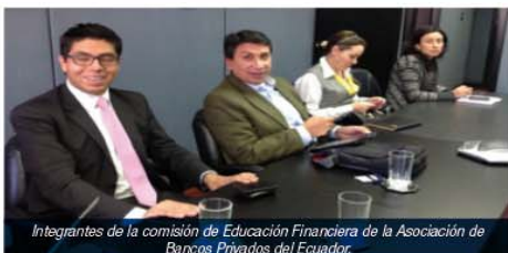
Integrantes de la comisión de Educación Financiera de la Asociación de Bancos Privados del Ecuador.