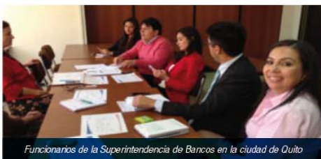
Funcionarios de la Superintendencia de Bancos en la ciudad de Quito