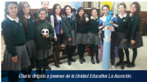
Charla dirigida a jóvenes de la Unidad Educativa La Asunción.