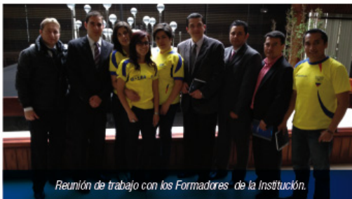
Reunión de trabajo con los Formadores de la Institución.