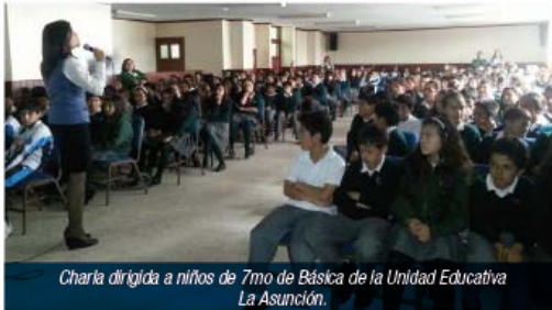
Charla dirigida a niños de 7mo de Básica de la Unidad Educativa La Asunción.