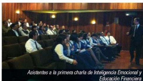
Asistentes a la primera charla de Inteligencia Emocional y Educación Financiera

Malla Curricular Adaptada al Contexto Ecuatoriano