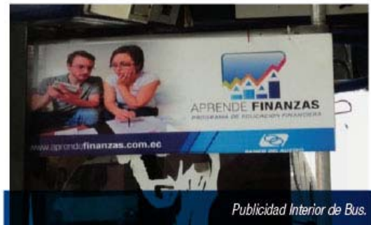
Publicidad Interior de Bus.