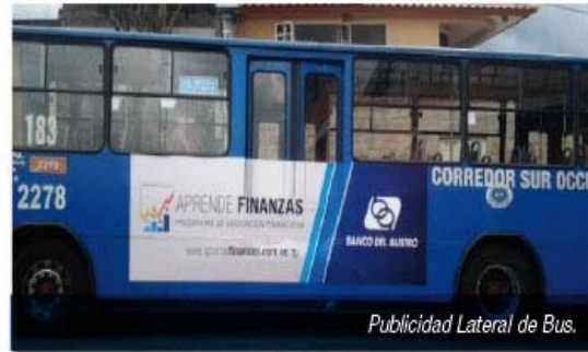
Publicidad Lateral de Bus.