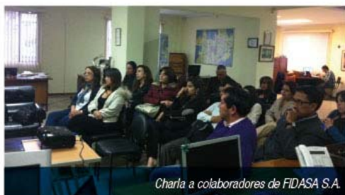
Charla a colaboradores de FIDASA S.A.