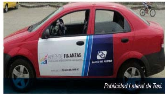
Publicidad Lateral de Taxi.