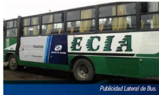
Publicidad Lateral de Bus.