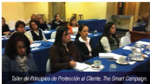
Taller de Principios de Protección al Cliente, The Smart Campaign.

En abril se concretarán aspectos importantes de la planificación mencionada, como son, entre otros, el funcionamiento cabal del Portal Web del PEF y acciones de publicidad del mismo.