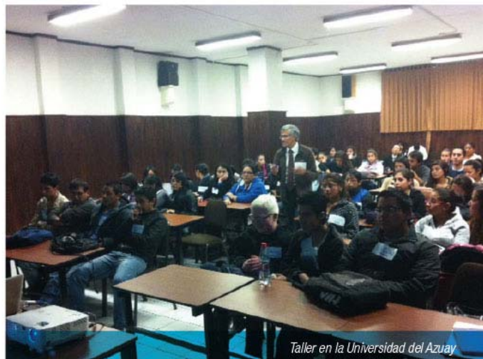
Taller en la Universidad del Azuay

El 20 de marzo el Directorio de la Institución conoció y aprobó el Plan 2014 del Programa de Educación Financiera, que incluyó la Estrategia y Presupuesto correspondientes.