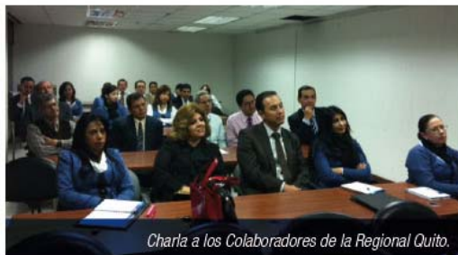
Charla a los Colaboradores de la Regional Quito.