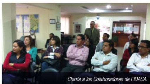
Charla a los Colaboradores de FIDASA.